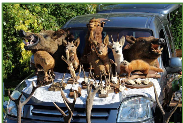
Le tableau de chasse d'un brocanteur, émule de Tartarin de Tarascon