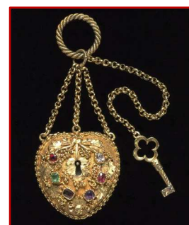
Médaille en forme de cadenas, vers 1840, Londres

"Source d'émotions, les bijoux ont de tous temps été choisis pour exprimer son amour à un être cher. Cadeaux intimes, dissimulant parfois une relation secrète, ces bijoux ont tant à nous raconter ! Parcourons leur histoire, de l'Antiquité à nos jours, et décryptons le langage secret de l'Amour."